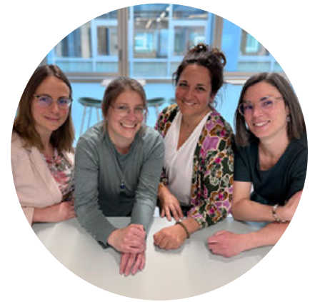
Nos Coordinatrices pédagogiques (de G. à D.)

Tout au long de l'année, assistantes parentales et enfants ont partagé des moments festifs : chasse aux œufs à Pâques, concert de guitare et portraits photographiques en juillet, marmite en chocolat et spectacle de marionnettes pour l'Escalade. Ces rituels construisent une identité collective autour du projet éducatif de la Fondation.