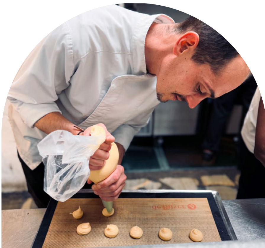
Dans les coulisses du restaurant Un R de Famille

L'acquisition des murs du restaurant d'application en 2025 change la donne. La Fondation est désormais propriétaire du site sur lequel elle forme depuis des années. Cela ouvre une réflexion concrète sur son réaménagement — pour améliorer les conditions d'apprentissage des apprenant·es et mieux accueillir les familles qui fréquentent le lieu. Les contours de ce projet seront précisés en 2026.